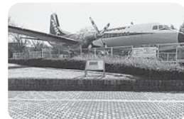
写真は航空公園停車場