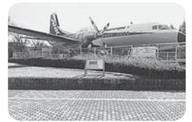
写真は航空公園停車場