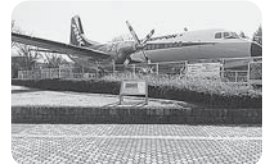
写真は航空公園停車場