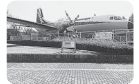
写真は航空公園停車場