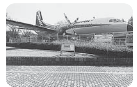
写真は航空公園駐車場